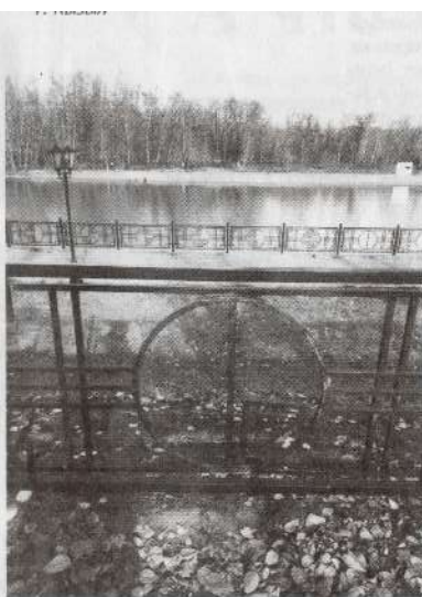
Повреждённый орнамент на ограждении

Есть у меня несколько вопросов к администрации Кызыла. Туристы, гости нашего города будут