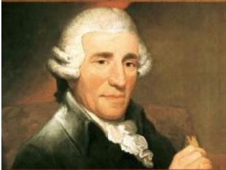
Франц Йо́зеф Га́йдн

Почти все симфонии, написанные венскими классиками, имеют четыре части: