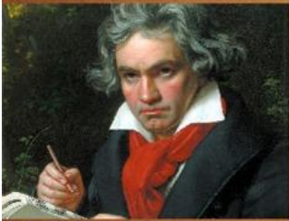
Людви́г ван Бетховен