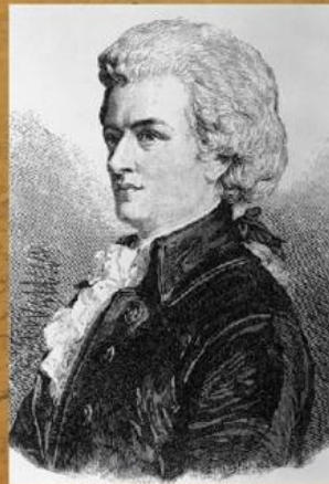
Мо́царт Вольфганг Амадей