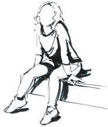
рис. (1). Неведомый